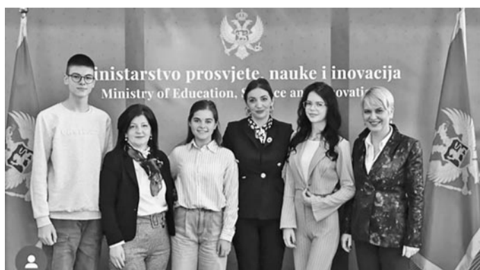
Подршка квалитетном образовању