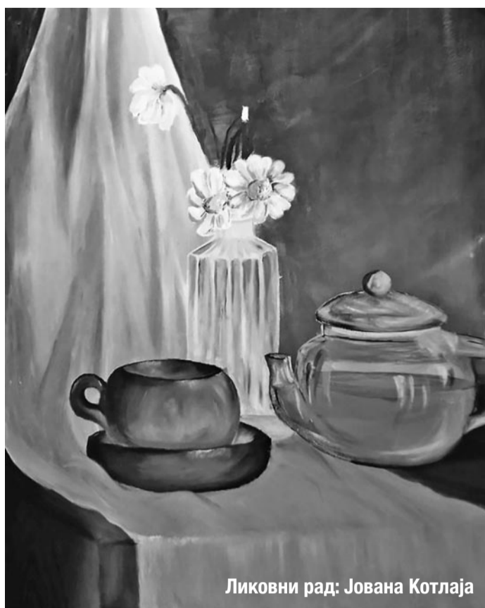
Ликовни рад: Јована Котлаја