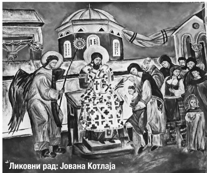
Ликовни рад: Јована Котлаја