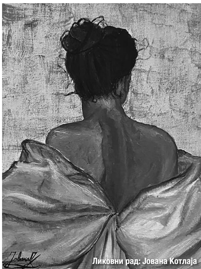
Likovni rad: Јована Котлаја